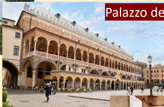
Palazzo della ragione