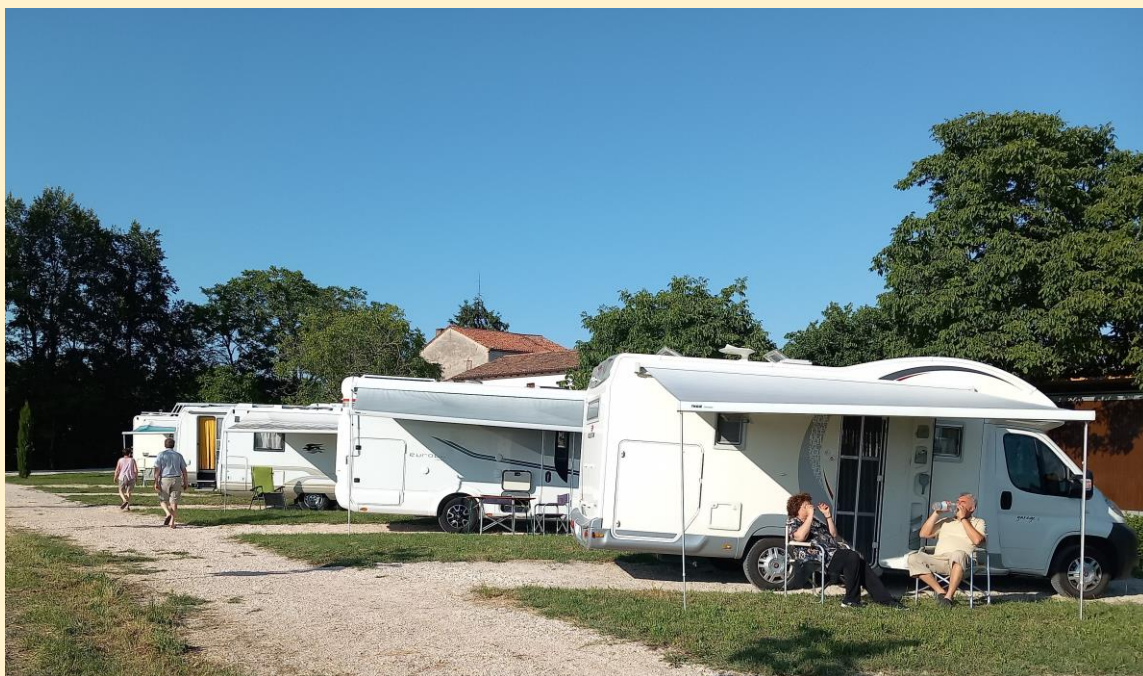
9 posti - allacciamento elettrico – carico acqua, scarico cassetta e nautico